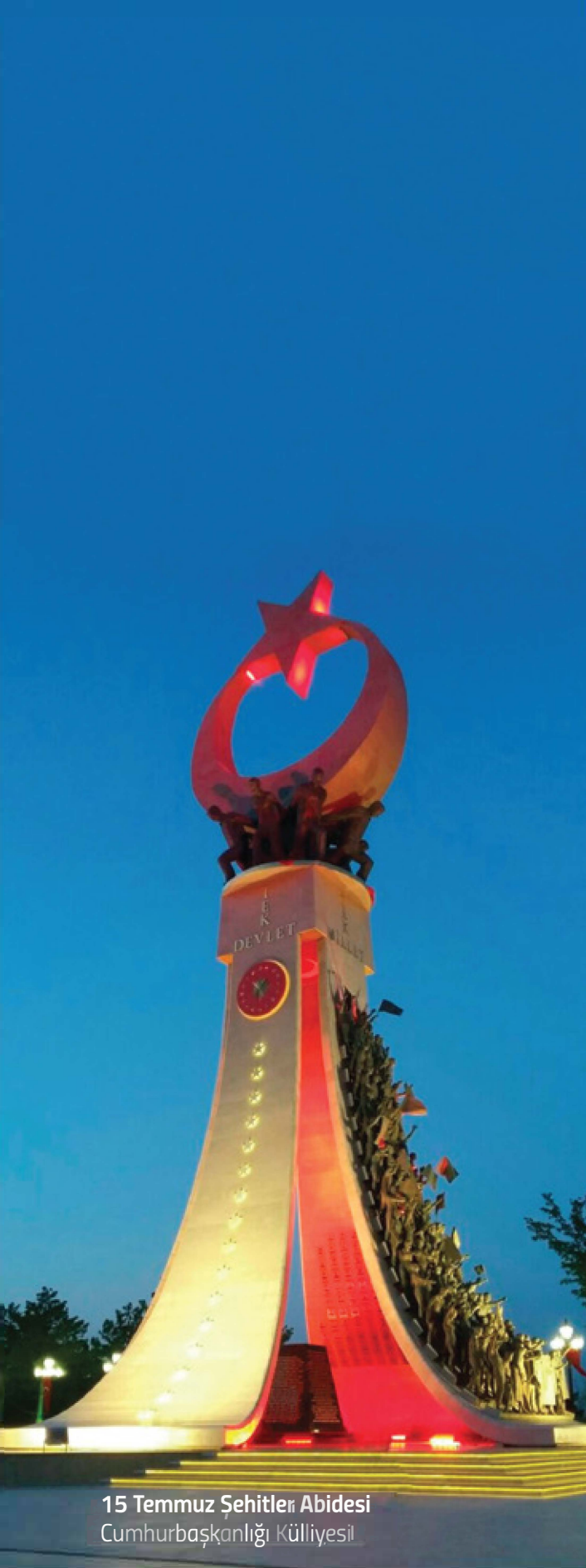
15 Temmuz Şehitleri Abidesi Cumhurbaşkanlığı Külliyesi