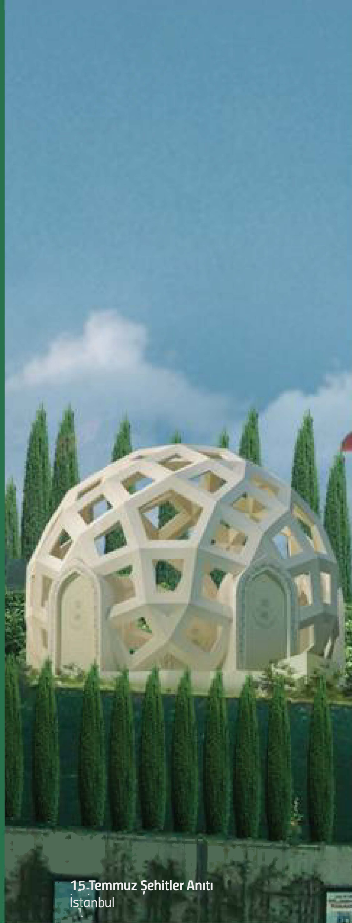
15 Temmuz Őehitler Anıtı İstanbul